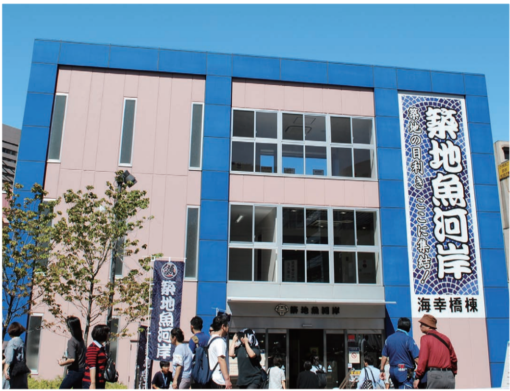
▲10月1日にグランドオープンした築地魚河岸 10月1日撮影

中央区議会は、国会及び政府に対し、住民票の除票等の保存期間を延長することで、所有者不明土地や空き家問題における所有者の特定が一層容易となるよう、左記事項の実現を強く求めます。 一 住民票の除票及び戸籍の附票の除票の保存期間を、現行の5年から150年程度に延長すること。 《他一項目》 衆議院議長・参議院議長 内閣総理大臣 総務大臣・法務大臣 農林水産大臣・国土交通大臣あて ※手話言語条例の早期制定を求める意見書